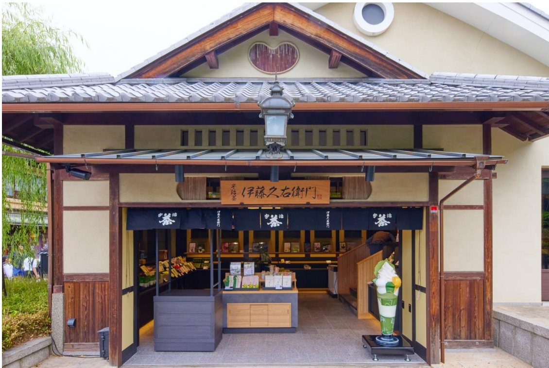
伊藤久右衛門 清水産寧坂店 外観