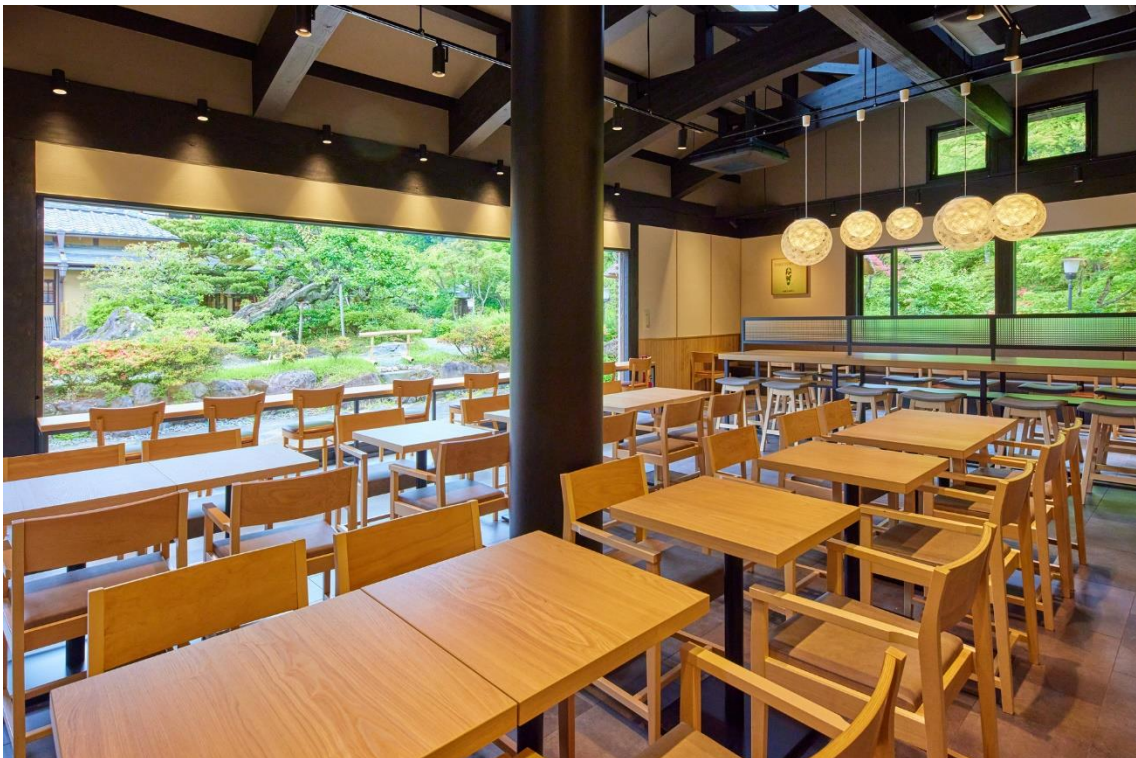
伊藤久右衛門 清水産寧坂店 内観（カフェ）

立地は、京都を代表する観光地「清水寺」へと向かう産寧坂（三年坂）の道中、七代目小川治兵衛（植治）が手掛けた庭園を臨む「青龍苑」内の一角。最寄りのバス停「市バス 清水道」から徒歩7分の場所にあります。