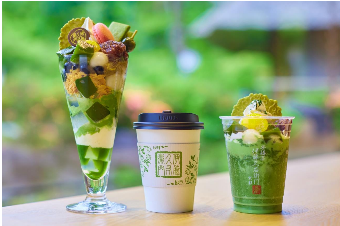
伊藤久右衛門 清水産寧坂店 内観（カフェメニュー）

清水産寧坂店カフェでは、3種の宇治抹茶パフェを提供するほか、煎茶やほうじ茶といった宇治茶は勿論、グリーンティーや抹茶ラテ、コーヒーや抹茶クラフトコーラ（夏季限定）もお楽しみいただけます。また、清水産寧坂店カフェ専用メニューとしてフローズンドリンクも開発いたしました。ティラミスやだいふく等のスイーツもテイクアウトメニューとしてご用意しております。京都有数の観光地で、庭園を眺めながら、本場・宇治の味わいを心ゆくまでご堪能ください。