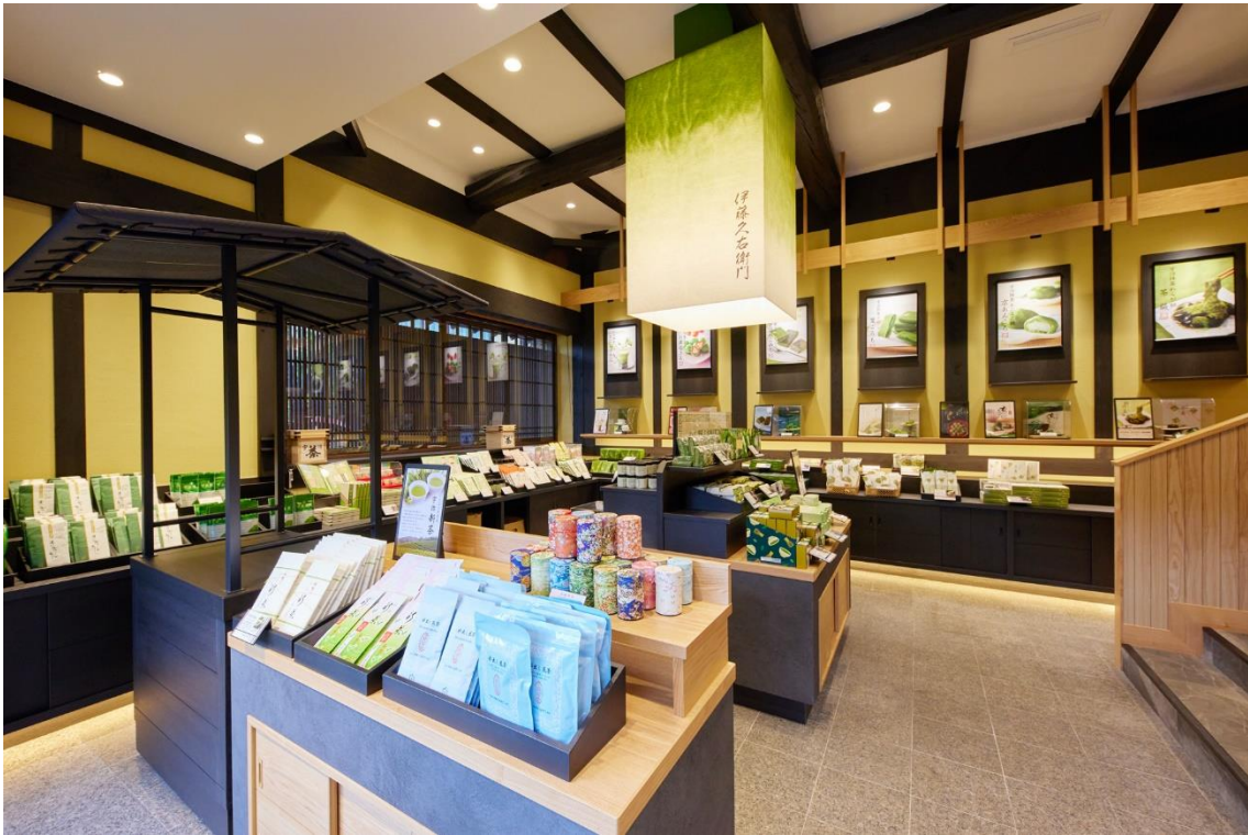
伊藤久右衛門 清水産寧坂店 内観（販売）

立地は、京都を代表する観光地「清水寺」へと向かう産寧坂（三年坂）の道中、七代目小川治兵衛（植治）が手掛けた庭園を臨む「青龍苑」内の一角。最寄りのバス停「市バス 清水道」から徒歩7分の場所にあります。